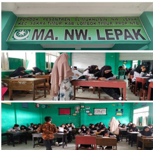
Gambar 2. Proses Penyebaran Angket Pre-Test