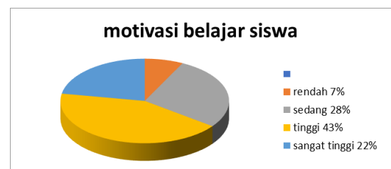
Gambar 3. Diagram Sebaran Motivasi Belajar Siswa