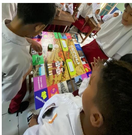
Gambar 2. Desain Sepoli yang ditempelkan pada papan kayu

Gambar 1. dan Gambar. 2 desain Sepoli yang sudah di cetak di tempelkan pada papan kayu yang didesain menyerupai papan catur. Di dalam Sepoli juga terdapat gambar-gambar yang berkaitan dengan materi yang diajarkan serta terdapat kartu kesempatan dan kartu mistery box yang mana kedua kartu tersebut berisi pertanyaan seputar materi serta bobot koin tiap soal dan tak lupa kartu zonk. Setelah media pembelajaran Sepoli telah siap, Langkah selanjutnya yaitu memberikan perlakuan media tersebut kepada siswa yang diteliti.