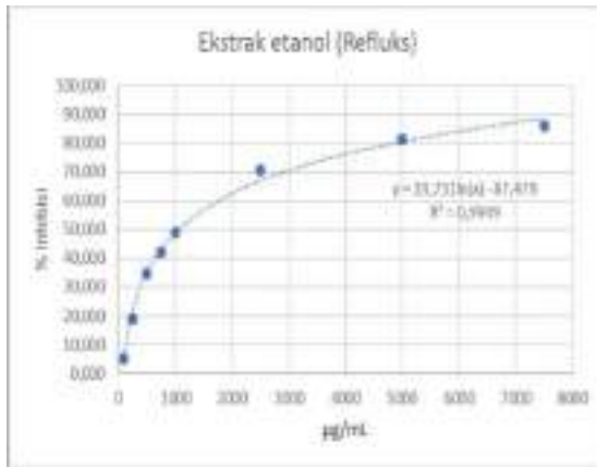
Gambar 2 Persamaan regresi aktivitas \alpha -glukosidase ekstrak etanol daun senggani teknik refluks